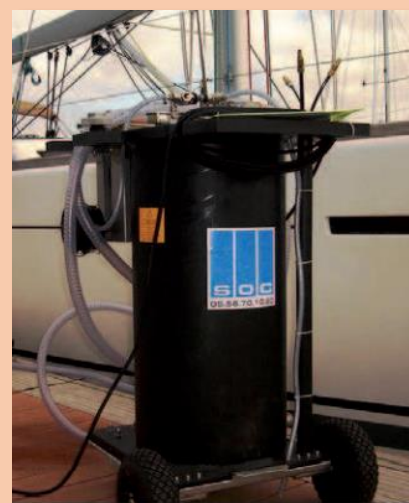
Pompe mobile – Eaux usées