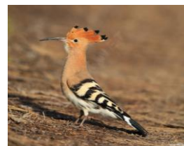
La Huppe fasciée