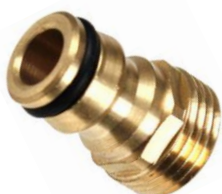
Raccord mâle laiton => tuyau

Pour la saison 2022 nous avons installé un système d'économie d'eau uniquement sur les points d'eau des berges A et B.