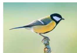
La Mésange charbonnière