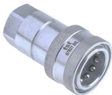
Raccord femelle => borne